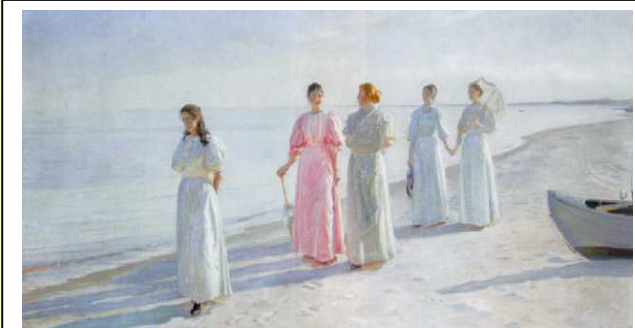
Michael Peter Ancher - Promenade on the Beach